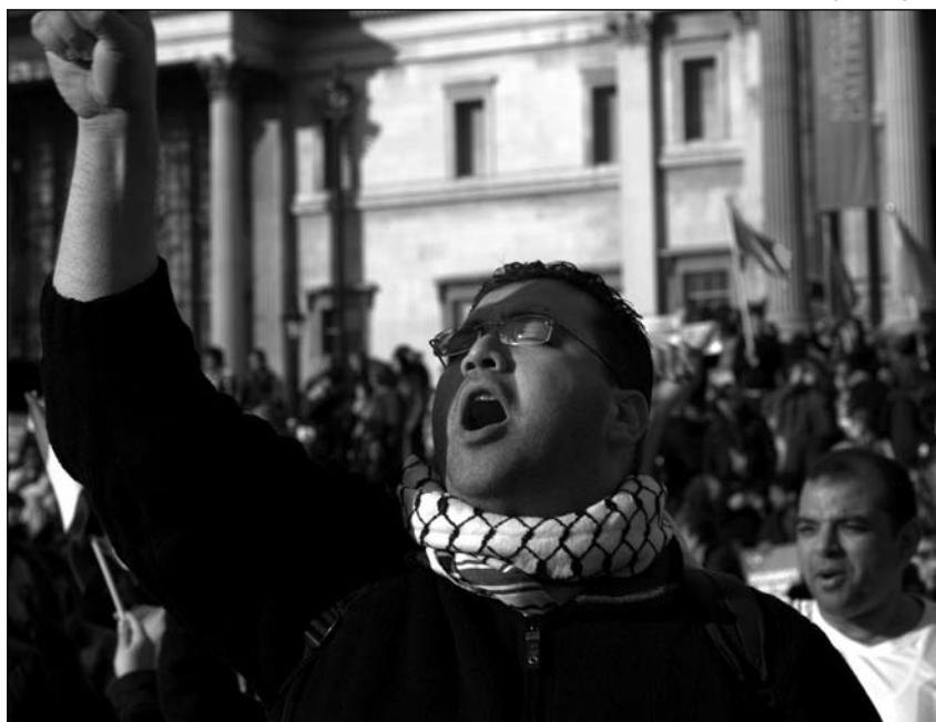
As revoltas árabes recibiron a solidariedade de medio mundo (Trafalgar Square, Londres, 2011)

Pola contra, e aleccionados polo errático exemplo libio, Rusia e China afrontaron na actual crise siria unha frontal