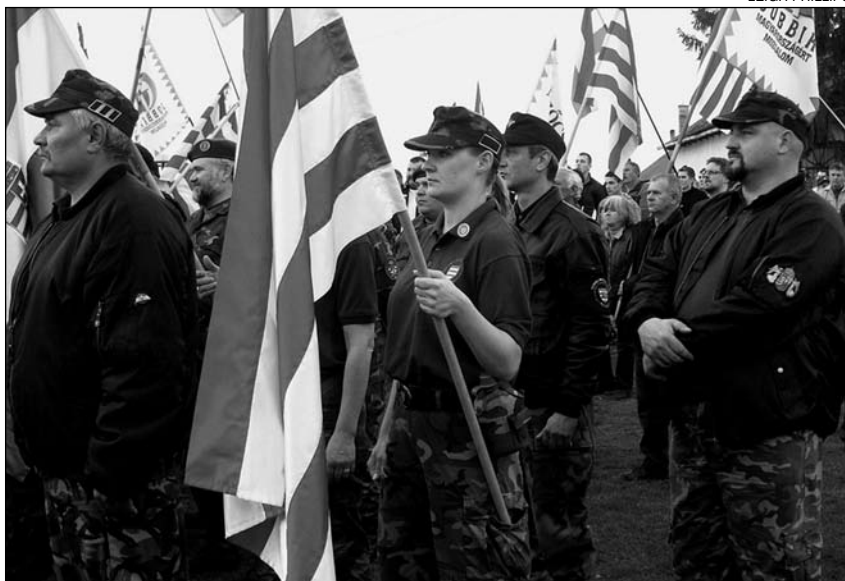
Paramilitares da Garda Maxiar nunha marcha do Jobbik contra o “terror xitano” en Hejosalonta (Hungria)

3 O perigo da extrema dereita repousa en dúas circunstancias, que poden ir vencelladas en función dos países: