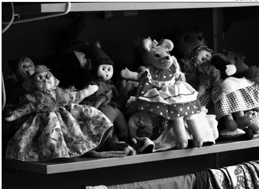
O comercio xusto abrangue múltiples produtos. Bonecas nunha tenda de Amarante en Compostela

Banca Ética. Son aqueles proxectos de intermediación financeira que ofertan os servizos bancarios habituais a persoas e organizacións que queren aten-