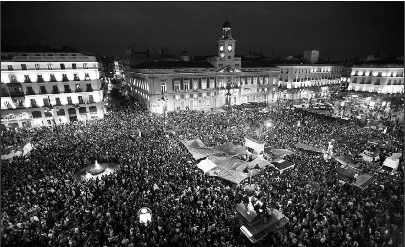
Dezenas de milhares de pessoas chegaram à Puerta del Sol e seus arredores, apesar da proibição, em jornada de reflexão o 21 de maio