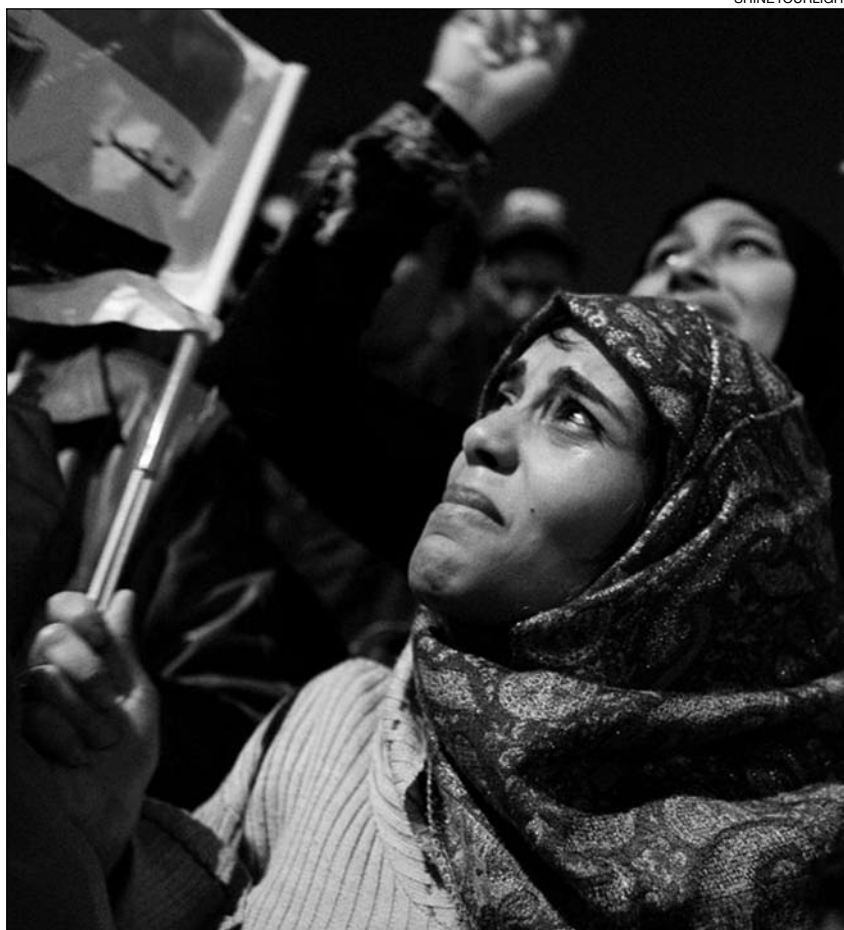
Unha muller exipcia escoita a nova da renuncia de Mubarak na praza de Tahrir

Deste xeito, o cosmético e “gatopardiano” reformismo marroquí constitúese na referencia clave para outras monarquías árabes como Xordania, Arabia Saudita, Bahrein, Kuwait e Emiratos Árabes Unidos, temerosos do espallamento da rebelión popular en escenarios importantes para os intereses ener-