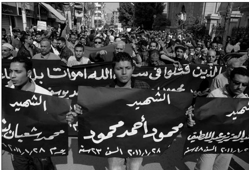
Manifestación en protesta polos mortos na revolta exipcia (Suez, Exipto, Febreiro de 2011)

"Pecamos de optimistas. La victoria de islamistas en Túnez y Egipto demuestra la irresponsabilidad y el exceso de optimismo por el deseo de ver revoluciones laicas" [Gustavo de Arístegui, diplomático e ex deputado do PP]