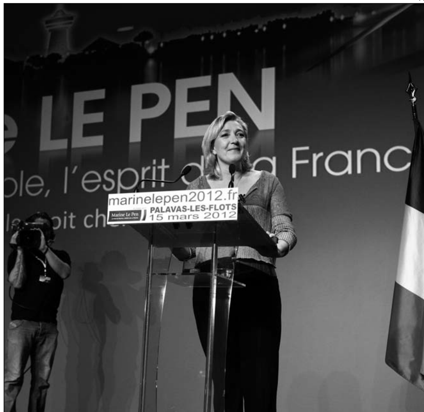
Marine, presidenta da Fronte Nacional e filla de Jean-Marie Le Pen, na campaña das presidenciais francesas