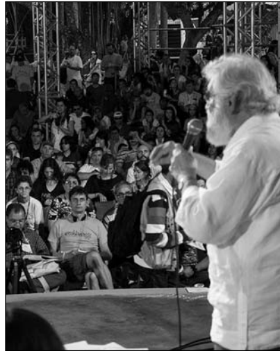
Boff falando no Cumio dos Pobos Río+20

mica: sobre a natureza como o seu dominador e explotador, razón fundamental da actual crise ecolóxica. Non entenden o ser humano como parte da natureza e responsábel do destino común. Non incorporaran a visión da nova cosmoxía que ve a Terra como viva e o ser humano como a porción consciente e intelixente da propia Terra, coa misión de coidar dela e garantirlle sustentabilidade. É vista só como un almacén de recursos, sen intelixencia e propósito.