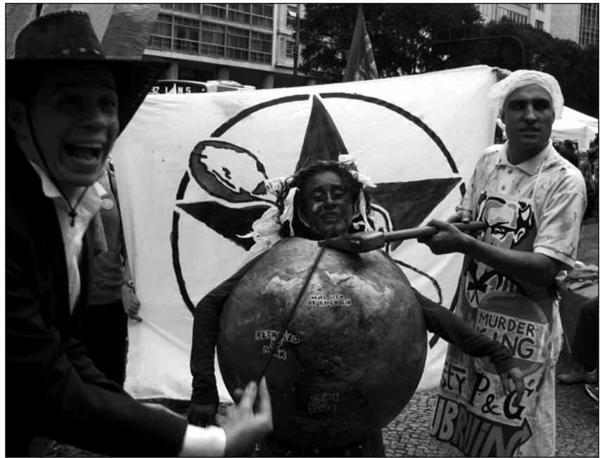
Teatralización no decurso do Cumio dos Pobos de Río+20

basea nunha fonte de recursos ilusoriamente renovábel, vén exacerbar os acaparamentos de terra e a disputa polo chan, auga e nutrientes que xa se agudizou coa promoción e subsidio de agrocombustíbeis. Ora ben, se calquera forma de cultivo, de plantación ou de natureza, pode ser a materia prima de combustíbeis, fármacos, forraxes e moitas sustancias industriais, a disputa coas terras indíxenas e campesiñas e áreas naturais medrará exponencialmente.