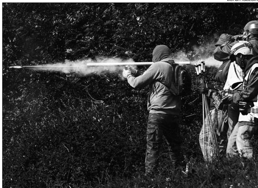
Resistencia de mineros en Asturias

Preocúpame máis a actitude de quen, as máis das veces desde fóra –nin son mineiros nin son quincemaieiros–, procuraron airear eventuais diferenzas entre uns e outros. Estas xentes, claramente excedidas polo que o 15-M acabou por supor, parecen decididas agora a recuperar o terreo perdido e escudarse detrás dos mineiros. Por fin a clase obreira reaparecería para deixar a cadaquén no seu sitio e, de for-