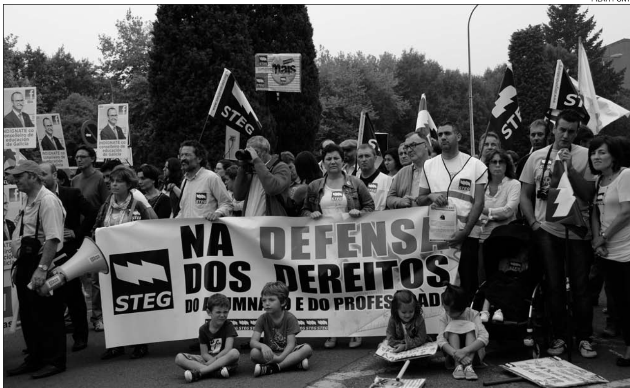
Manifestación en Santiago de Compostela contra os recortes no ensino (9/09/2011)

temento aos intereses ideolóxicos da patronal.