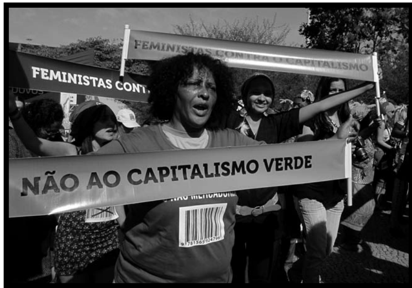
Marcha "Feministas contra o capitalismo, Non ao capitalismo verde", durante o Cumio dos Pobos Río+20

O capitalismo busca desesperadamente novas fontes de negocio para se reproducir. O produtivismo e o consumismo, ligados sobre todo ao Norte xeopolítico, toparon cuns límites planetarios insalváveis e a emancipación de moitos pobos do Sur, que albergan a meirande parte de recursos naturais. As billas van pechando. Ao tempo, a crise económica afogou a vía do capitalismo