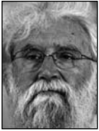
Leonardo Boff Teólogo, filósofo e ecoloxista brasileiro

N on se corresponde coa realidade dicir que Río+20 foi un éxito. Non se chegou a ningunha medida vinculante nin se crearon fondos para a erradicación da pobreza, nin mecanismos para o control do quecemento global. Non se tomaron decisións para a realización do propósito da Conferencia, que era crear as condicións para o “futuro que queremos”. Está na lóxica dos gobernos non admitir os fracasos. Mais non por iso deixan de selo. Dada a degradación xeral de todos os servizos ecosistémicos, non progresar significa retroceder. No fondo, afirmase: se a crise se atopa no crecemento, daquela a solución darase con máis crecemento aínda. Iso concretamente significa: máis uso dos bens e servizos da natureza, o que acelera o seu esgotamento, e máis presión sobre os ecosistemas, xa nos seus límites. Datos dos propios organismos da ONU din que desde Río '92 houbo unha perda dun 12% da biodiversidade, 3 millóns de metros cadrados de bosques foron esnaquizados, un 40% máis de gases con efecto invernadoiro emitidos e preto da metade das reservas de pesca mundiais esgotadas.