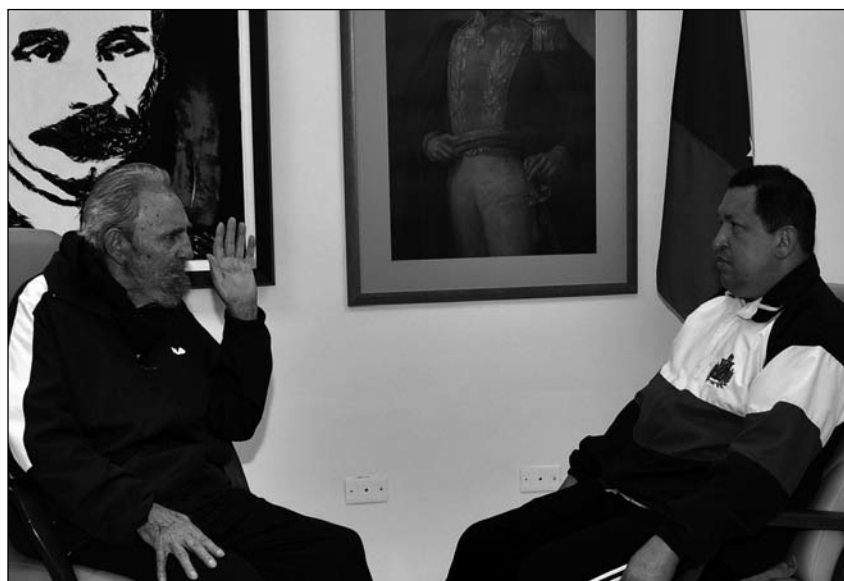
Disque se a situación de Chávez en Cuba se agrava podería haber eleccións en Venezuela en marzo

Ambos os dous sucesos, e a forma en que sexan resoltos, van definir boa parte do desenvolvemento dos acontecementos políticos no vindeiro ciclo 2013-2014. Paraguai era o eslabón máis feble dos procesos de mudanza do continente, cun Fernando Lugo refén dos seus pactos de gober-