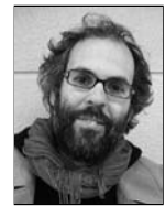
Alberte Román Trespés Sociedade Cooperativa Galega

O proxecto de documental 'En todas as mans' trata de valorizar a figura dos montes veciñais en mancomún, unha realidade pouco ou nada coñecida por boa parte da sociedade galega