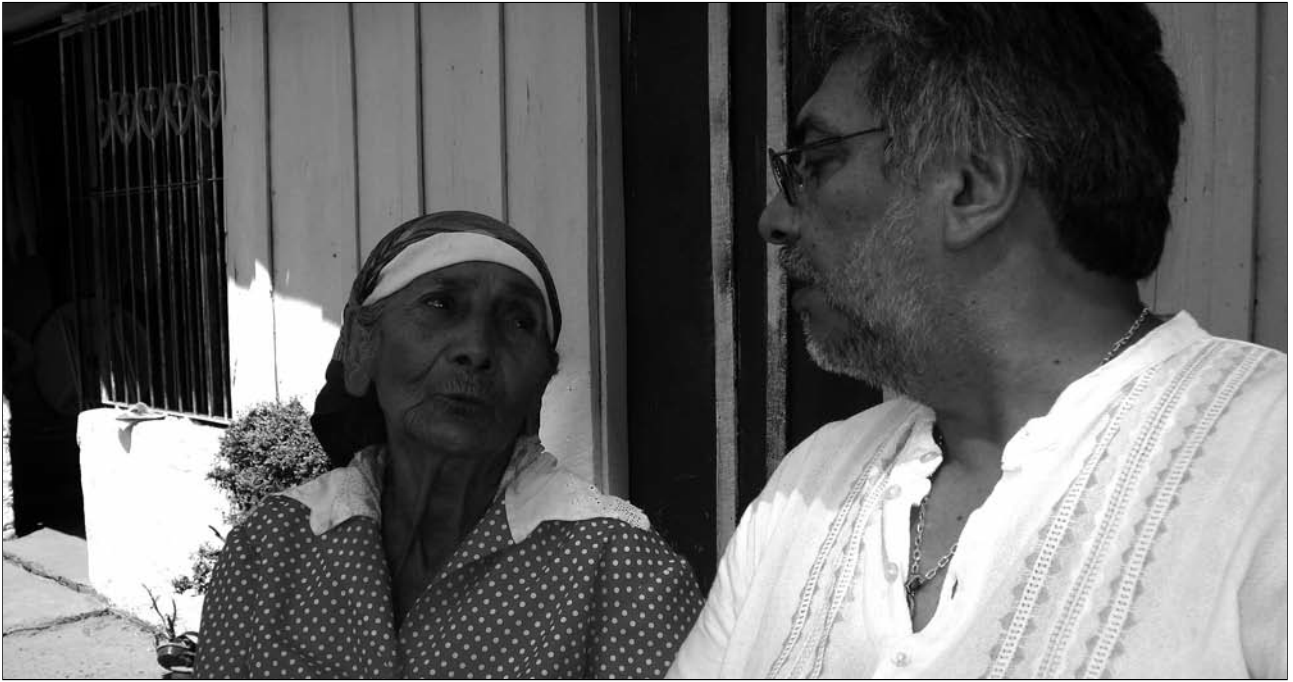
O ex presidente Fernando Lugo advertiu hai poucos días que teme unha fraude nas eleccións que terán lugar o 21 de abril no Paraguai

da poboación latinoamericana. En 18 países de América Latina, o 10% máis rico da poboación recibe o 32% dos ingresos totais, mentres que entre todo o 40% máis pobre téñense que repartir o 15% deses ingresos.