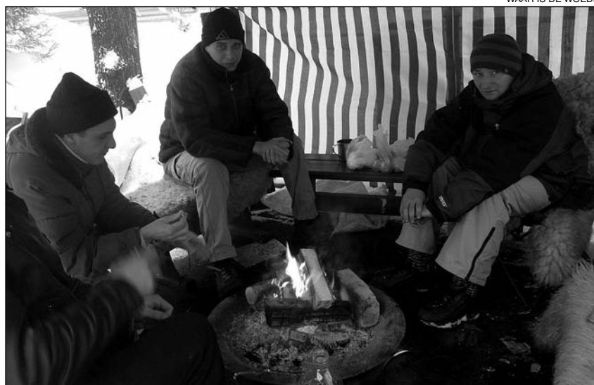
WAAR IS DE WOEDE

recentemente, na Europa enteira. O rastro de destrución é longo e devastador.