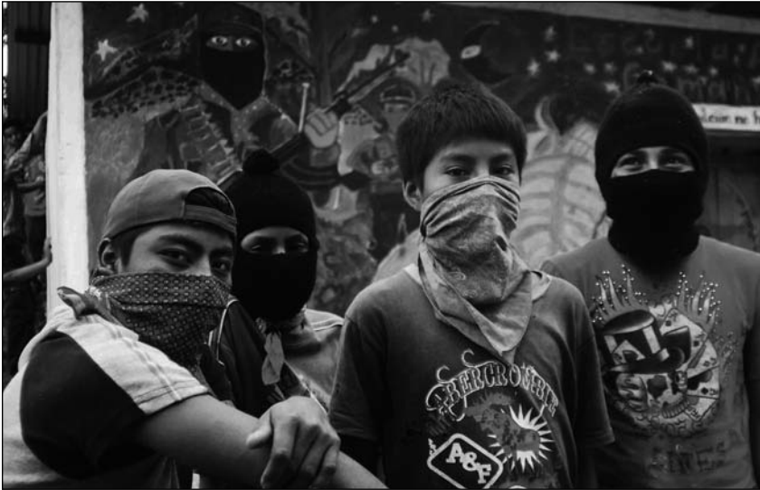
A marcha zapatista contou con maioría de mozos e mozas que aínda non naceran o 1 de xaneiro de 1994

dade Nuevo Poblado Comandante Abel, situada no municipio autónomo La Dignidad (oficialmente, Sabanilla) na zona norte de Chiapas.