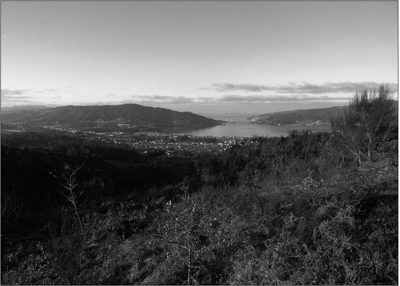
O mundo dende o monte veciñal d'O Viso, en Redondela, onde este xaneiro a cooperativa Trespés realizará unha repoboación.

ás xuntas reitoras. En ocasións son estes procesos os que determinan a incorporación de novos discursos á visión do monte. Por iso o noso interese en que o documental se constrúa como discurso colectivo a partir das voces da xente das diferentes comunidades, dando visibilidade ás realidades presentes no monte veciñal.