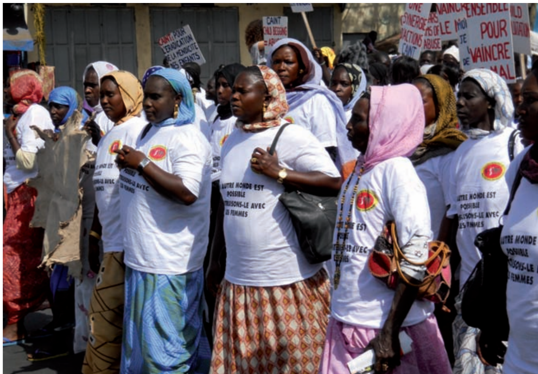
O movemento altermundista prolonga e renova moitos movementos sociais históricos, que converxen para se enfrontar ao neoliberalismo e ao capitalismo

As bases sociais do altermundismo e as súas alianzas dependen dos desafíos do período, das saídas que se presentan á crise: o neoconservadorismo de guerra; a refundación do capitalismo a través dun "Green New Deal"; a superación do capitalismo. As bases sociais no caso do neoconservadorismo de guerra incum-