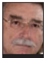
IGNACIO RAMONET Presidente de Mémoire des Luttes

Para ambas as dúas cuestións, as respostas son de diversa natureza: histórica, económica, climática e social.