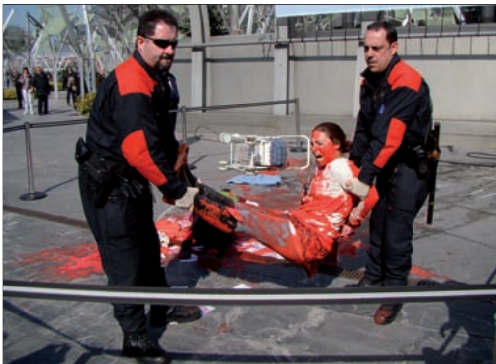
Protesta da Plataforma contra o BBVA (bbvahiltzaile.blogspot.com) o pasado 11 de marzo en Bilbao

Jordi leva anos practicando o “activismo accionarial”, que con-