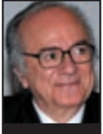
BOAVENTURA DE SOUSA SANTOS Director do Centro de Estudos Sociais da Universidade de Coimbra

O pasado día 8 de Marzo celebrouse o Día Internacional da Muller. Os días ou anos internacionais non son, en xeral, celebracións. Son, pola contra, modos de sinalar que hai pouco para celebrar e moito para denunciar e transformar.