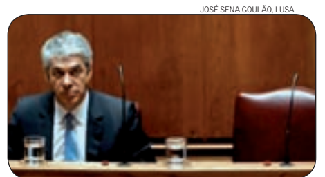
JOSÉ SENA GOULÃO, LUSA