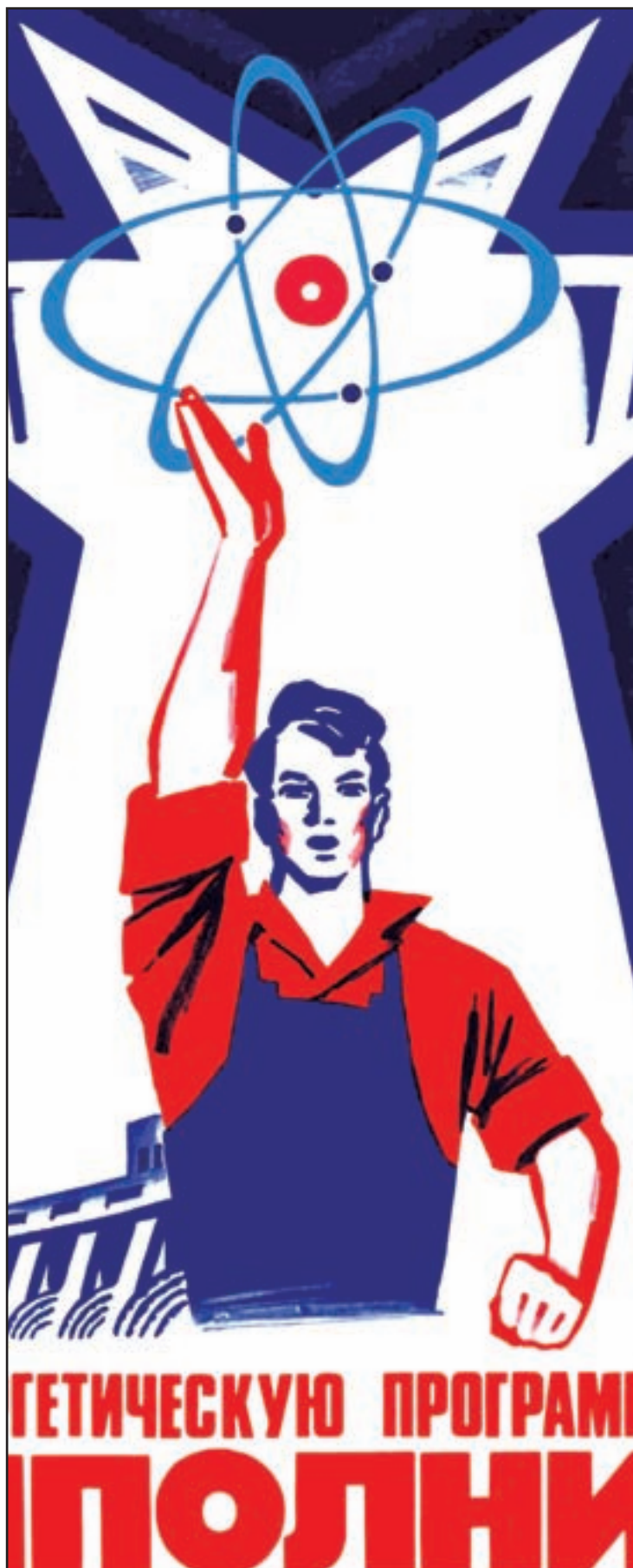
Imos cumprir co programa enerxético! (anaco dun cartaz da URSS, 1984)

Ficamos no entanto a saber tamén que nun dos países tecnoloxicamente máis avanzados do mundo a regulación da industria nuclear é unha broma de mal gusto. Soubemos que a empresa que opera a central de Fukushima ten un longo ca-