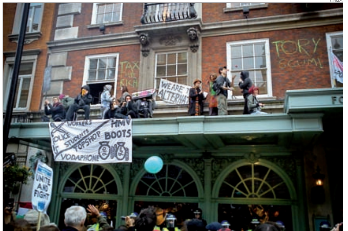
Ocupación pacífica de Fortnum & Mason durante as protestas anti-recortes do 26 de marzo en Londres