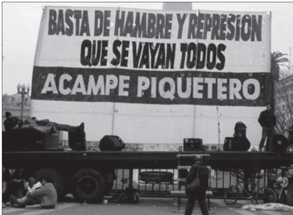
Despois do "arxentinazo" e das protestas dos días 19 e 20 de decembro de 2001, que fixeron dimitir ao presidente Fernando de la Rúa -causaron 39 mortos-, moitos traballadores ocuparon fábricas pechadas e as reactivaron. Tamén se ocuparon moitos espazos públicos para actividades comunitarias, sociais, culturais e asistenciais, nunha onda de autoxestión popular sen precedentes. Os movementos piqueteiros -de desempregados- como os da fotografía (2002), xurdidos unha década antes polos despedimentos de YPF (despois Repsol-YPF), tamén tomaron rúas e prazas.

"Que marchen todos!" subiu o nivel da ira, abriu un novo nivel de loita por un mundo diferente. Primeiro porque non só esixía a expulsión dun político, como acontece tan a miúdo -De la Rúa, Mubarak, Berlusconi-, senón de toda a clase política. E segundo, e máis fundamental, por-