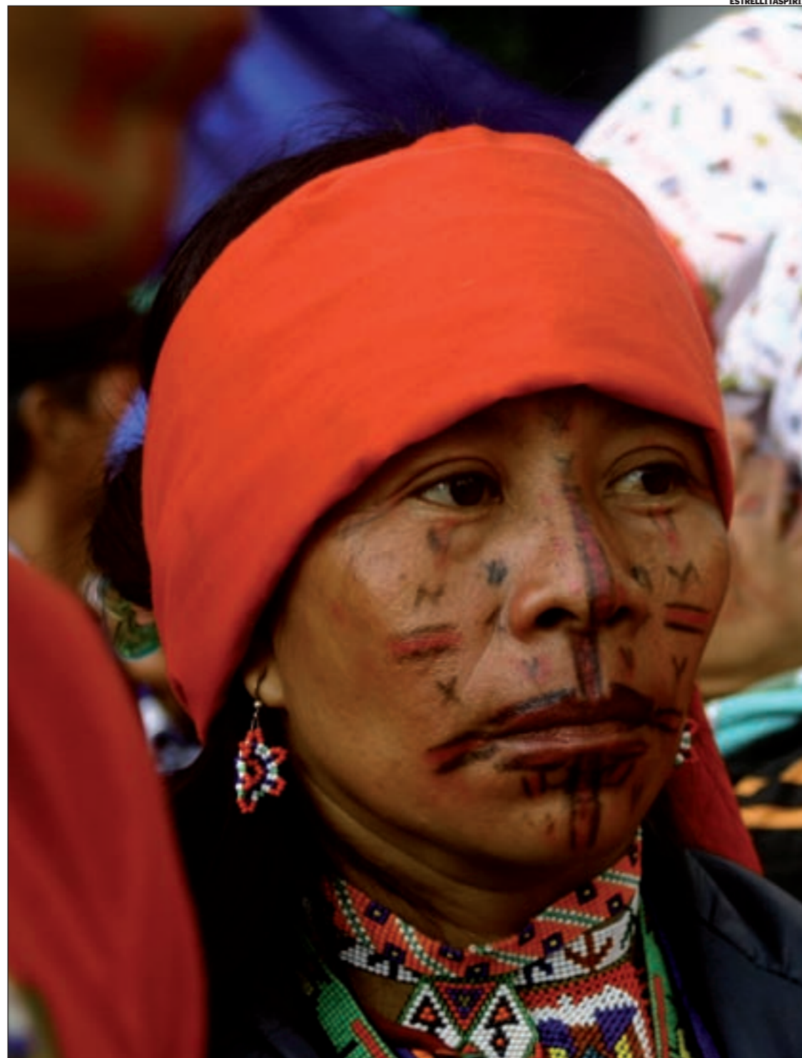
Os movementos “políticos” idealizan o ascenso ao poder de movementos indixenistas en América Latina

Outra lectura integradora, entre outras: aquela dos “dereitos” como plataforma básica de todas as loitas (Gustave Massiah). Os “dereitos”, polo seu papel vinculante e unificador, dan a este “movemento de movementos” unha plataforma común: a aspiración a unha regulación polos dereitos, para substituír unha regulación polo mercado. Non fala só de reequilibrar o discurso dominante sobre os dereitos, articulando os dereitos civís e políticos, os dereitos económicos, sociais, culturais, os dereitos dos pobos, os dereitos á alimentación, á saúde, ao traballo, á vivenda, etc., senón tamén de ampliar a perspectiva a outros aspectos da vida comunitaria, esenciais na dignidade humana, aumentando así os dereitos ambientais, os dereitos sexuais, reprodutivos, da paz, etc. Indivisíbeis e non xerárquicos, os dereitos individuais e colectivos e o conxunto de loitas que buscan confirmalos ou defendelos con-