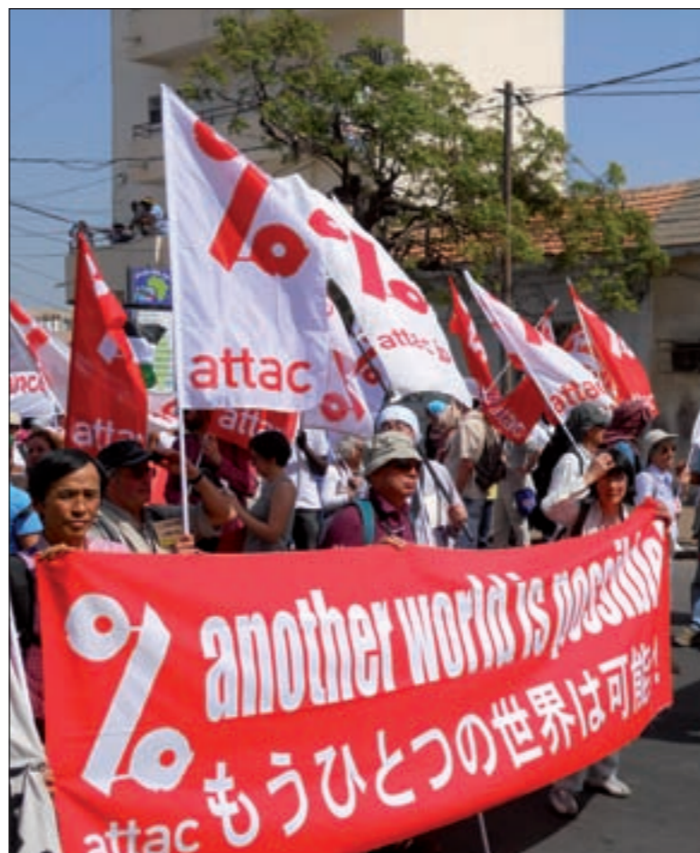
Nos foros sociais mundiais artéllanse loitas de todos os puntos do planeta