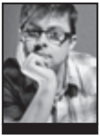
LEIGH PHILLIPS Xornalista. Reporteiro de EUobserver e corresponsal para Europa da revista Red Pepper

É abraiante a pouca cobertura mediática que houbo no Reino Unido (RU) sobre unhas medidas absolutamente revolucionarias e polifacéticas reveladas recentemente pola UE, como resposta á crise da eurozona e que entran dentro do que Bruxelas chama