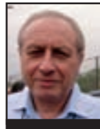
BERNARD CASSEN Xornalista. Mémoire des luttes. É tamén presidente de honra de Attac Francia

En Bruxelas, os membros da Comisión e os funcionarios odian os referendos: en primeiro lugar, porque son organizados a nivel nacional, e xa que logo, en desacordo coa lóxica supranacional da construción europea, e en segundo lugar, porque son unha expresión directa da soberanía popular, sen o filtro das institucións da democracia representativa, coa que son posibles moitos arranxos. Ese tipo de comicios lémbrenos –para ben ou para mal– que os pobos seguen a existir no Vello Continente. Cando menos a curto prazo, a noción de “pobo europeo” segue a ser en gran medida unha simple ficción.