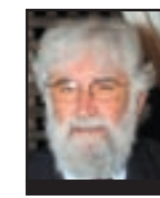
LEONARDO BOFF Teólogo e filósofo brasileiro