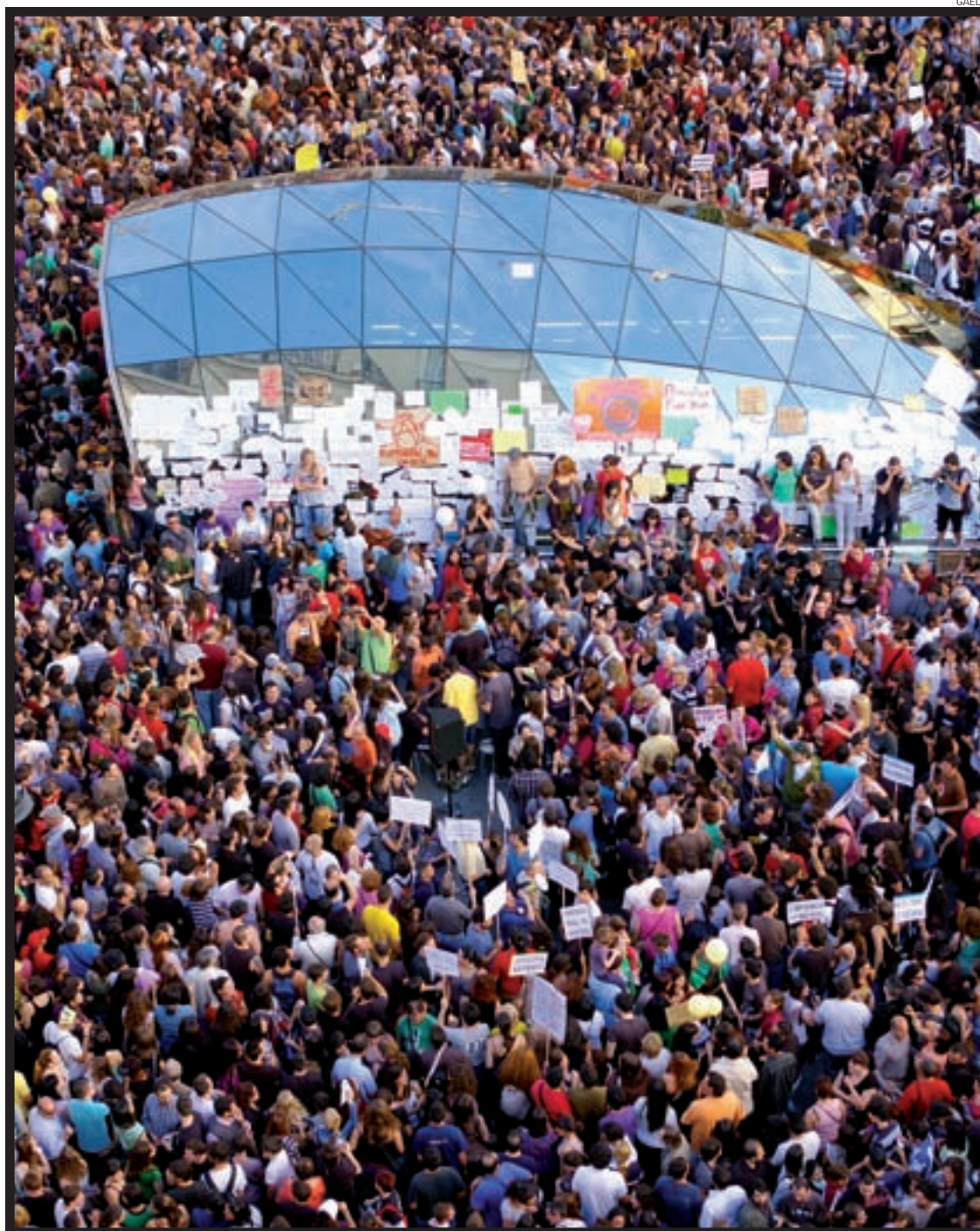
Madrid, acampada na Porto do Sol (20/05/2011)

Tamén hai que tomar en consideración o feito, ben interesante, de que o movemento viu a luz nun intre marcado polo final do curso en universidades e institutos, algo que reduciu as súas posibilidades de despregamento nunhas e outros. A planificación respecto diso destas cuestións –que convida a pensar inevitablemente no medio prazo– é, en calquera caso, unha tarefa vital