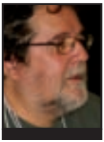
PIERRE BEAUDET Profesor de socioloxía da Universidade de Ottawa (Canadá). Co-fundador de Alternatives International e do Consello Internacional do Foro Social Mundial

Reunidos en París, a finais do pasado maio, os representantes das organizacións membros do Consello Internacional do Foro Social Mundial (FSM) reflexionaron sobre o futuro do proceso nun novo contexto marcado polo desenvolvemento dos movementos populares nos países árabes